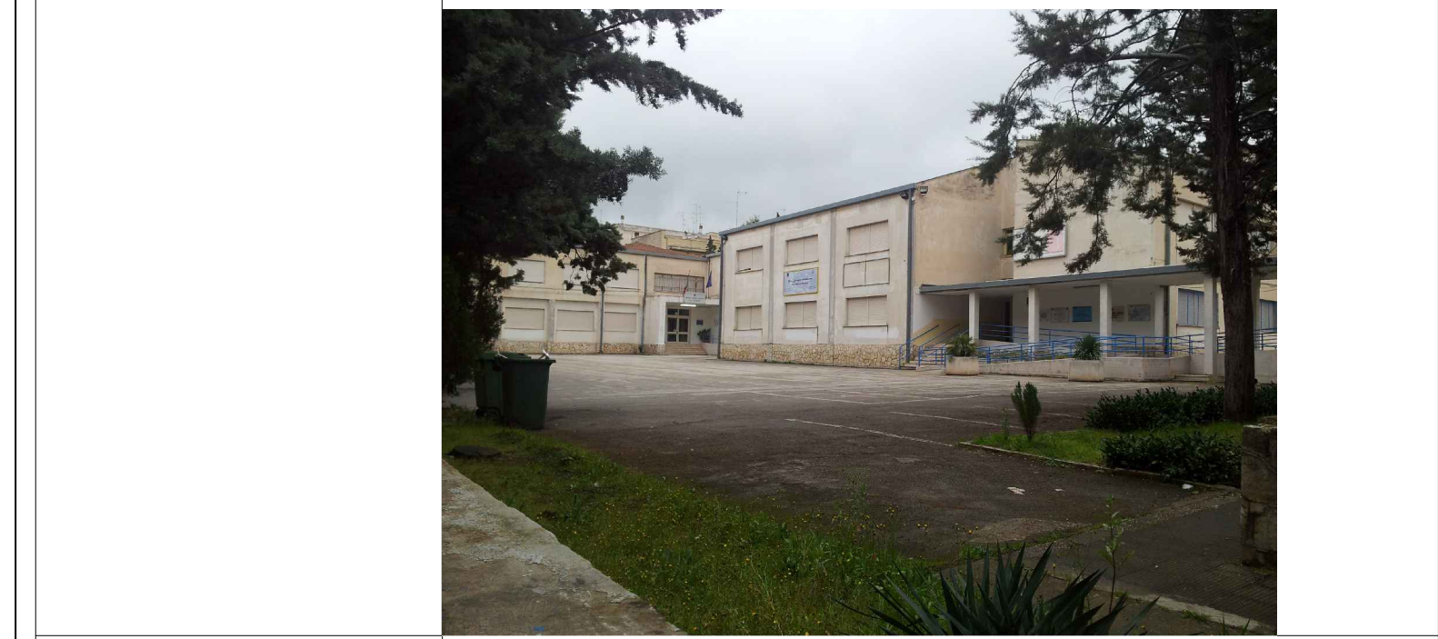
TAVOLA 4.2 AZIONE C2 - 1: ADEGUAMENTO DEGLI IMPIANTI ELETTRICI PROGETTO ESECUTIVO

Progettista arch. Michele MASTRODONATO Responsabile del procedimento Prof.ssa Angela AMENDOLA